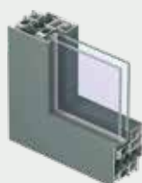
STRAK MODERN BLIND