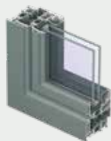
RELIËF KLASSIEKE STIJL